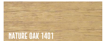
NATURE OAK 1401