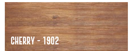
CHERRY - 1902