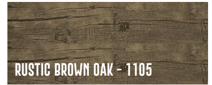
RUSTIC BROWN OAK - 1105