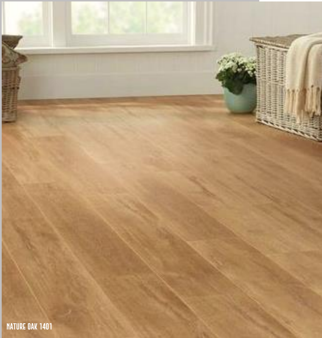
NATURE OAK 1401