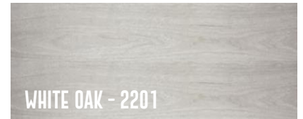
WHITE OAK - 2201