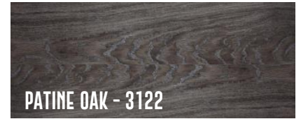
PATINE OAK - 3122